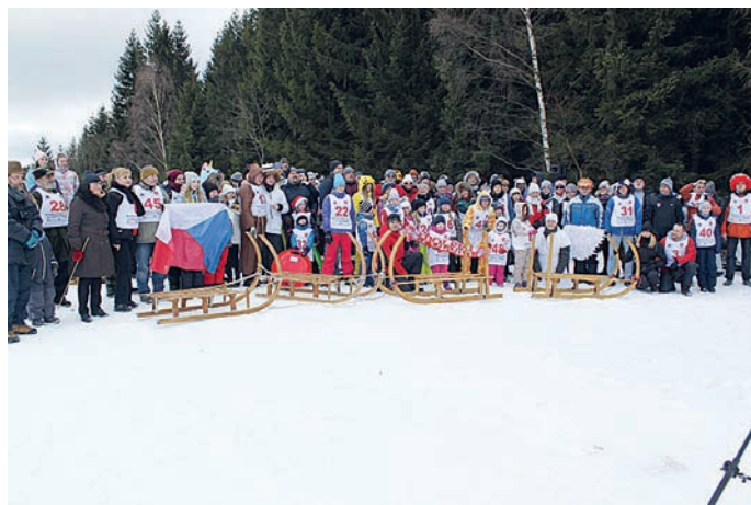
fol. zjazd na saniach rogatych