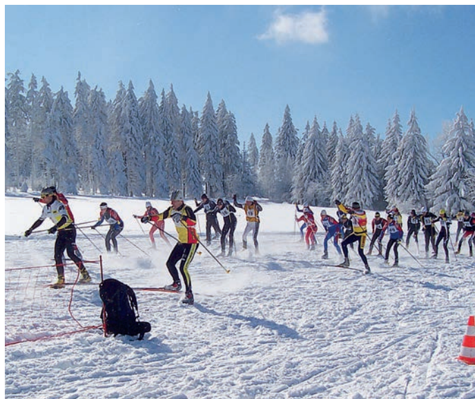
fol. trasy narciarstwa