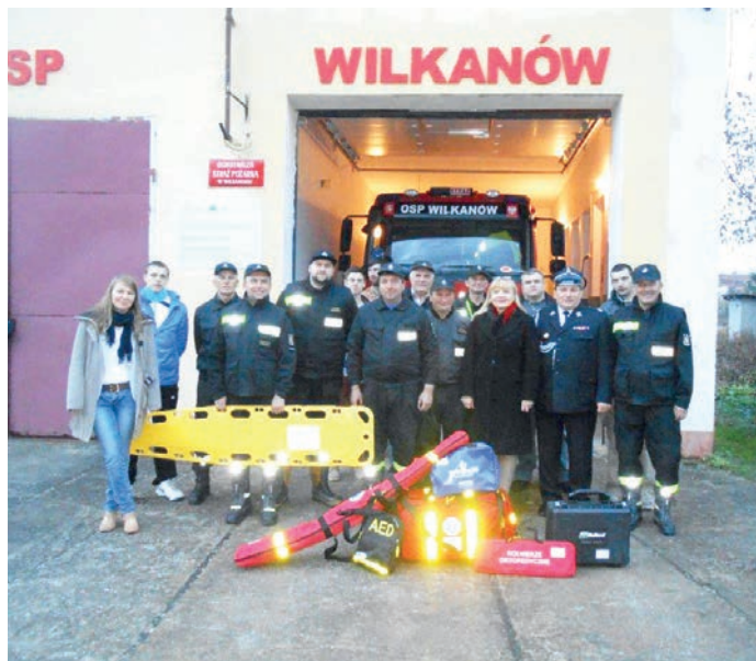
fol. OSP Wilkanów z wyposażeniem

Wartość zadania: 67.657,00 zł Dofinansowanie: 57.508,45 zł