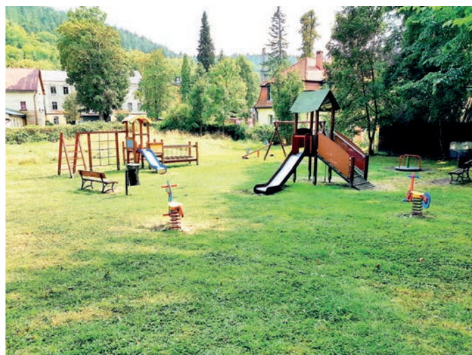
fol. plac zabaw w Długopolu-Zdroju