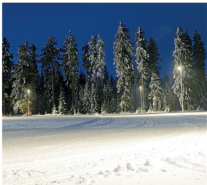
fol. oświetlone trasy narciarstwa