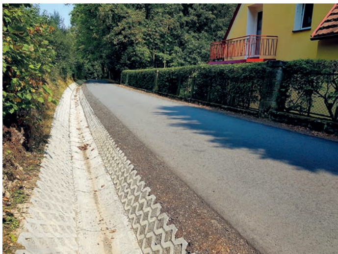
fol. ul. Leśna