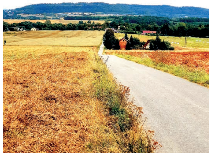
fol. droga gminna od drogi wojewódzkiej nr 388

5. Usługi w zakresie konserwacji i utrzymania oświetlenia drogowego i parkowego na terenie wsi Gorzanów i Kolonii Muszyn w latach 2014 – 2018 roku.