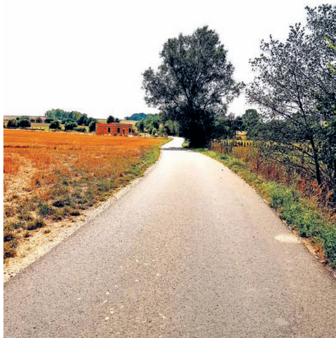
fol. droga gminna nr 119669D wewnętrznej dz. nr 642, 616, 740/1

4. Utrzymanie i bieżące naprawy świetlicy wiejskiej w Idzikowie, doposażenie i strona internetowa.