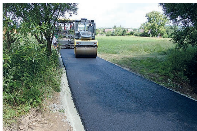
foto. droga gminna od drogi powiatowej nr 3231D

2. Utrzymanie i bieżące naprawy sali sportowej.