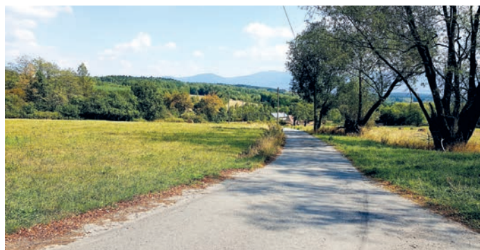
fol. remont drogi gminnej w kierunku posesji nr 80 w Ponikwie

2. Transport uczniów do placówek oświatowych.