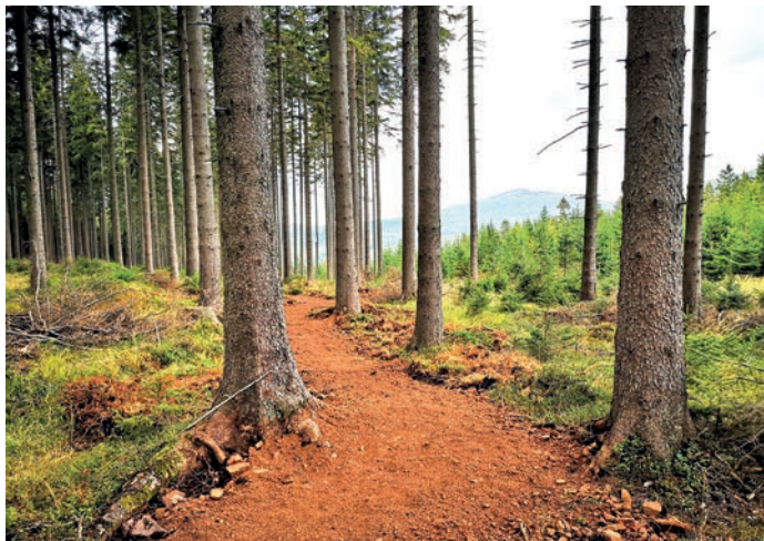
fot. ścieżki leśne w Masywie Śnieżnika