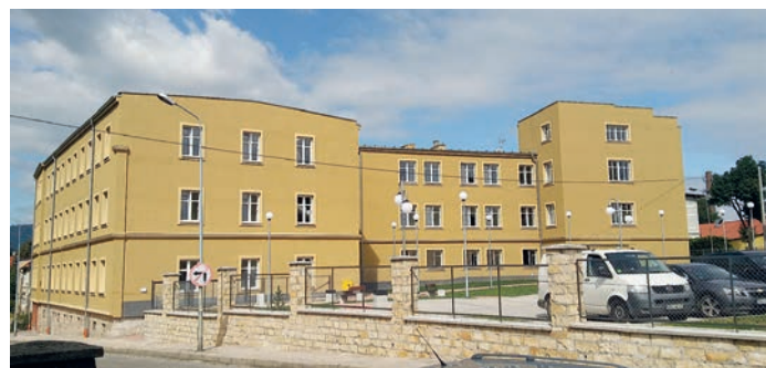
fot. budynek mieszkalny przy ul. Strażackiej 3

2. Rekultywacja składowiska odpadów komunalnych ul. Kolonia w Bystrzycy Kłodzkiej.