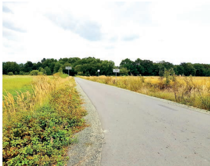
fol. droga gminna od drogi powiatowej nr 3238D w kierunku cmentarza