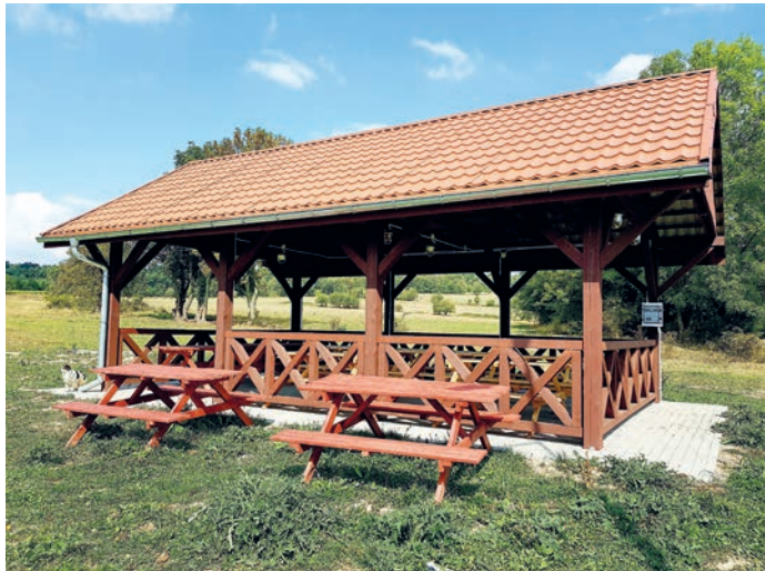
fol. wiaty drewniana w Ponikwie

7. Przebudowa drogi gminnej – wewnętrznej dz. nr 215 w miejscowości Ponikwa.