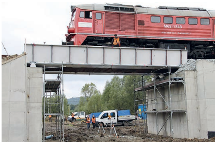
fot. budowa nowego wiaduktu kolejowego