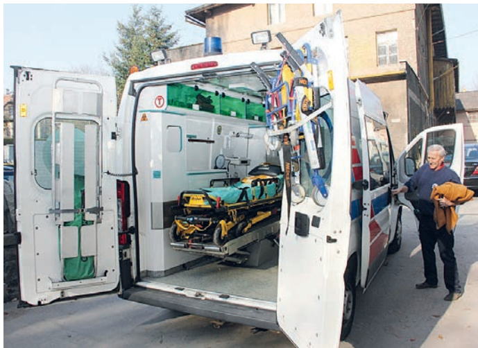
fol. ambulans Peugeot BOXER