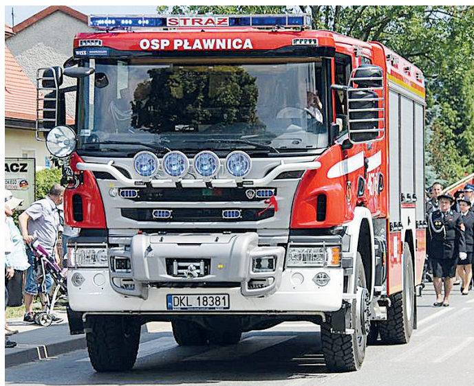
fol. samochód pożarniczy OSP Pławonica