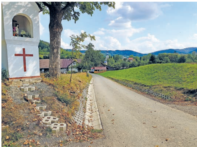
fot. droga gminna dz. Nr 678

4. Utrzymanie i bieżące naprawy Świetlicy Wiejskiej w Nowym Waliszowie.