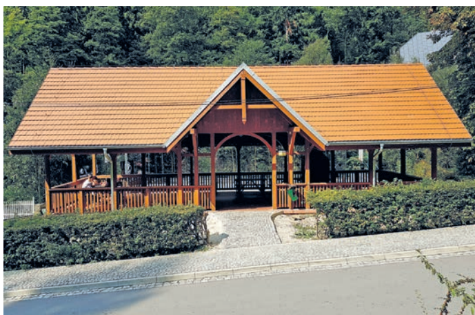
fot. wiaty w Międzygórzu

6. Usługi w zakresie konserwacji i utrzymania oświetlenia drogowego i parkowego na terenie wsi Międzygórze w latach 2014 – 2018 roku.