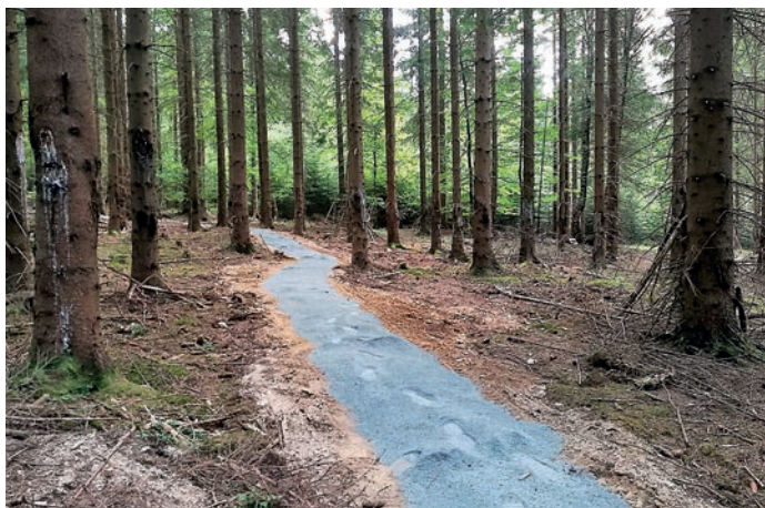
fot. ścieżki leśne w Masywie Śnieżnika

4. Transport uczniów do placówek oświatowych.