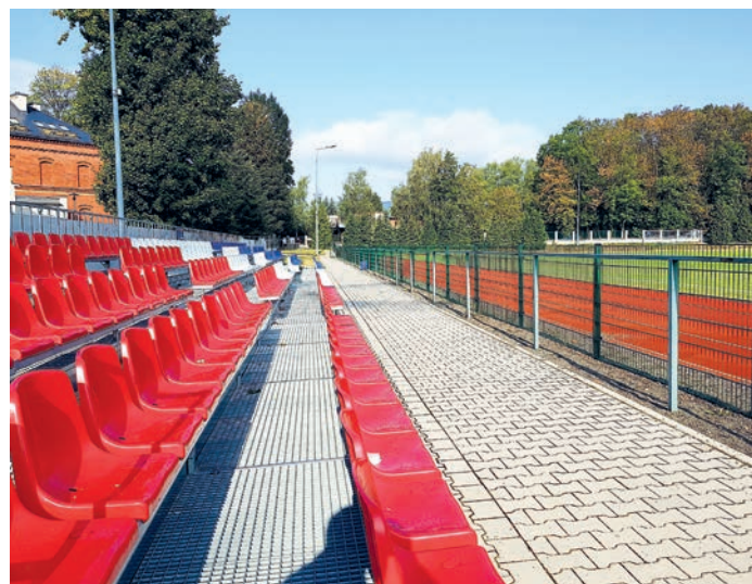
fot. stadion w Bystrzycy Kłodzkiej

4. „Bystrzyca Kł. – Przystań Floriańska”.