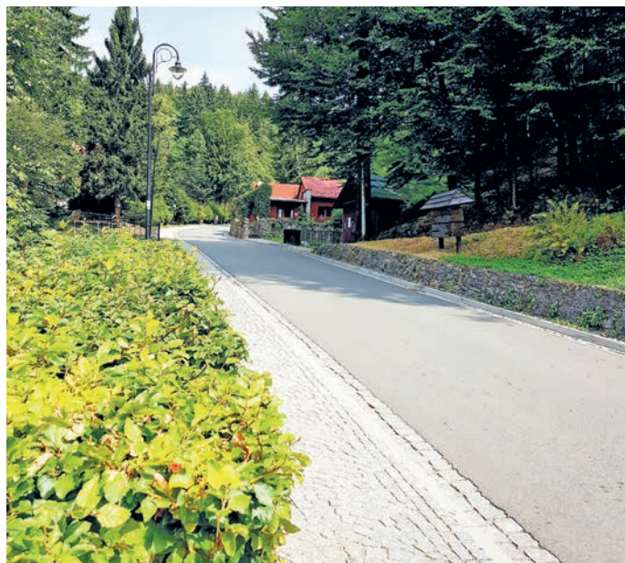
fot. ul. Sanatoryjna