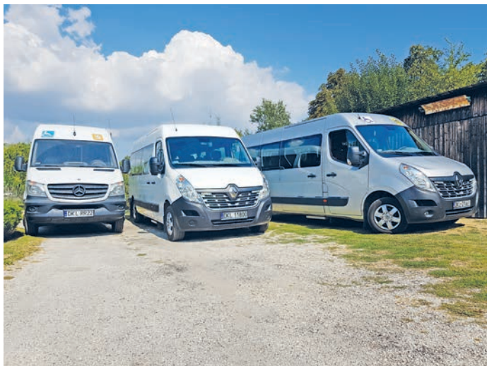
fol. 3 nowe busy do przewozu uczniów

Wartość zadania: 559.527,00 zł Dofinansowanie: 189.073,00 zł