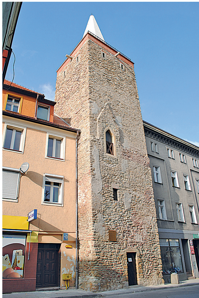
fol. Baszta Kłodzka, ul. Okrzei