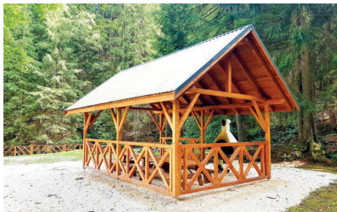
fot.wiata z grillem w Młotach

2. Transport uczniów do placówek oświatowych.