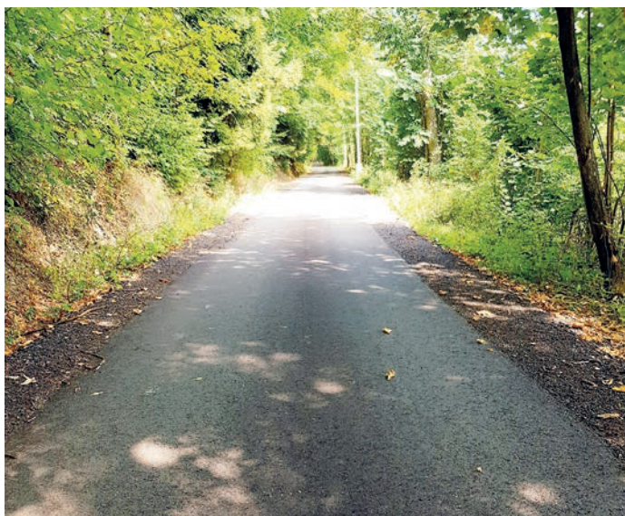
fol. droga gminna dz. Nr 356

2. Transport uczniów do placówek oświatowych.