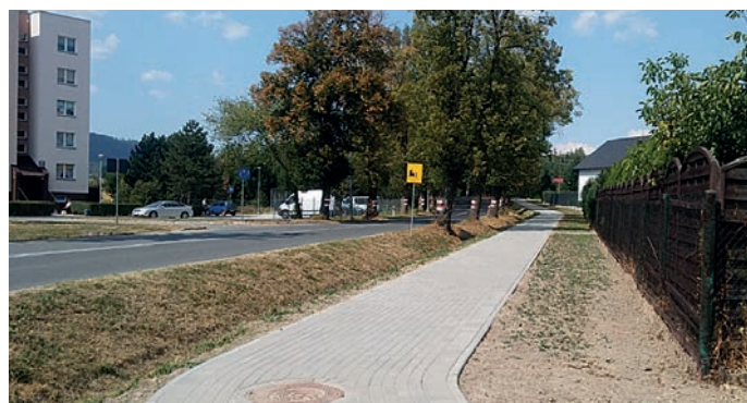
fot. budowa chodnika przy ul. Strażackiej