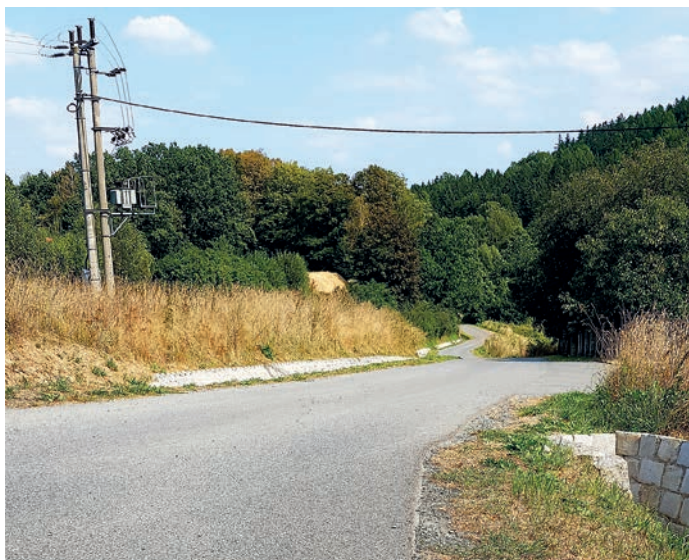
fol. droga gminna w kierunku osiedla