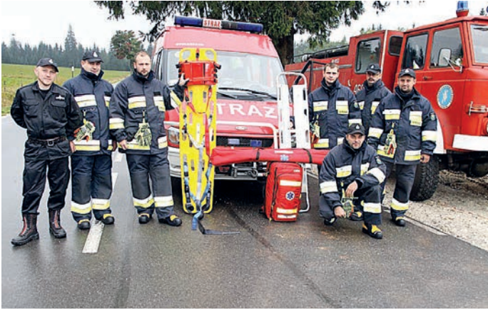
fot. OSP Zabłocie z wyposażeniem

10. Wydatki na potrzeby wsi m.in. zakup paliwa i artykułów do utrzymania czystości i porządku itp.