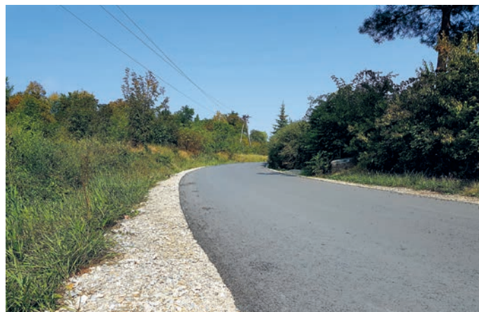
fot. droga gminna od ul. Willowej w kierunku łądowiska