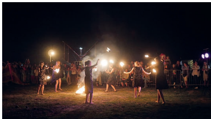
fol. pokaz „fireshow” teatru ulicznego „TUB”