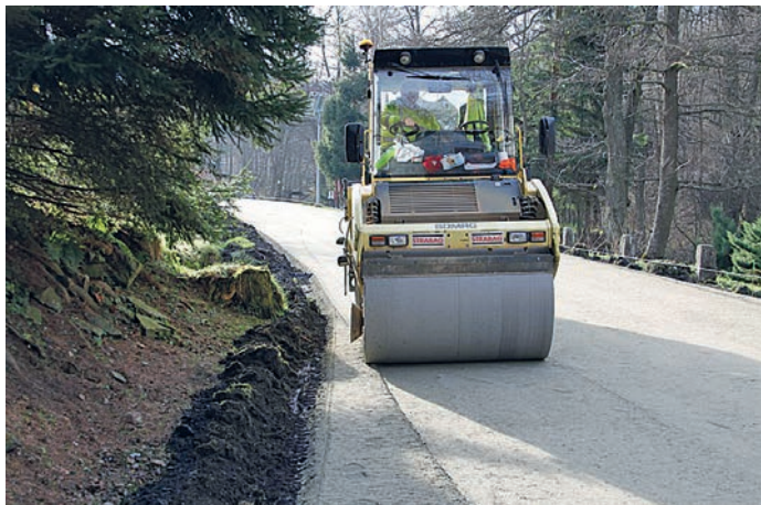
fot. poprawa dostępności transportowej Gór Orlickich i Bystrzyckich