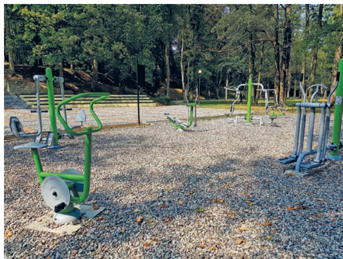
fol. siłownia zewnętrzna