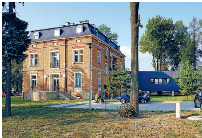
fot. budynek przedszkola nr 2