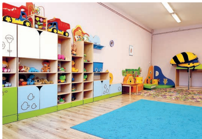
fot. jedna z sal Żłobka „Bystrzaki”

*2. Złożono wniosek o dofinansowanie na przebudowę sali gimnastycznej z łącznikiem w Szkole Podstawowej nr 2 w Bystrzycy Kł.