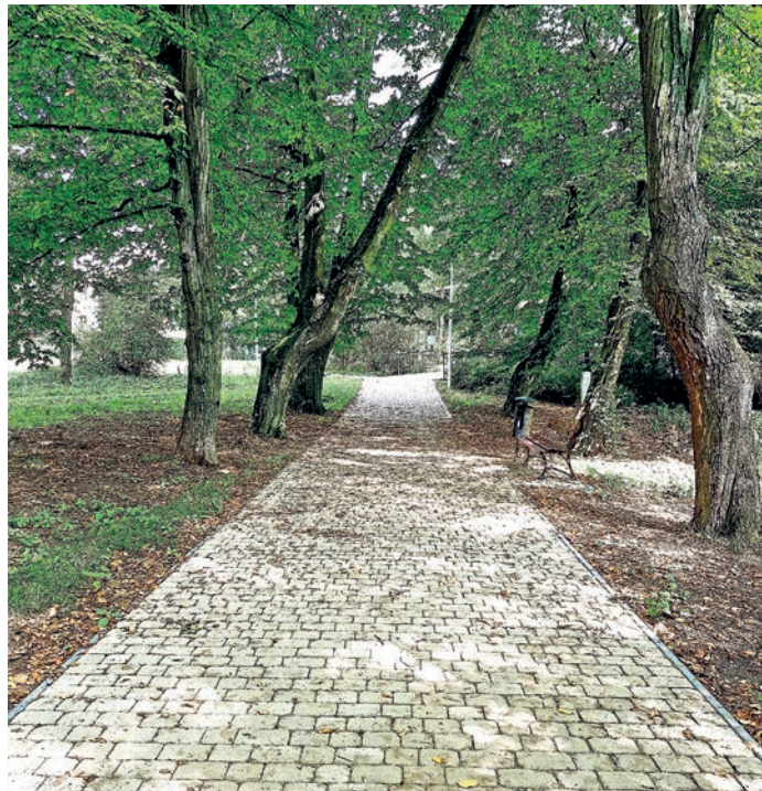
fot. park w Nowym Waliszowie

3. Remont drogi gminnej dz. nr 678 od drogi powiatowej nr 3228D w kierunku posesji nr 87, 88, 89.