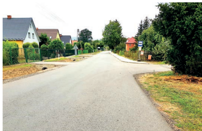
fol. droga powiatowa nr 3237D

2. Przebudowa drogi gminnej od drogi powiatowej nr 3238D w kierunku cmentarza i byłego PGR dz. nr 424, 412/2, 442 w m. Gorzanów.