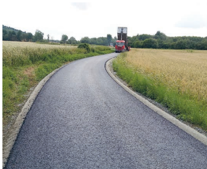
fol. droga gminna Pławonica – Stary Waliszów