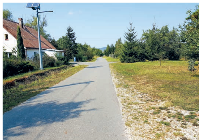
fot. droga gminna dz. nr 930

2. Ekwiwalent dla strażaków jednostki OSP za udział w akcjach ratowniczo – gaśniczych.