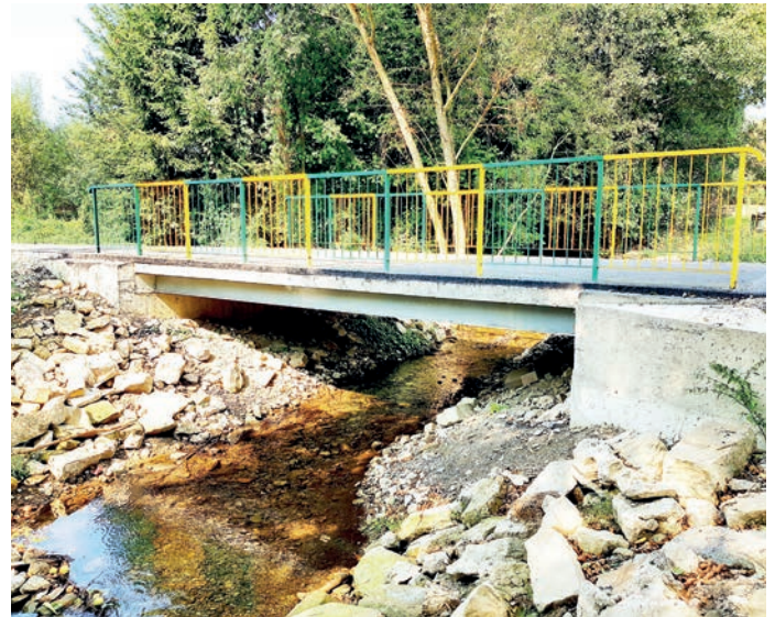
fol. most w ciągu drogi gminnej