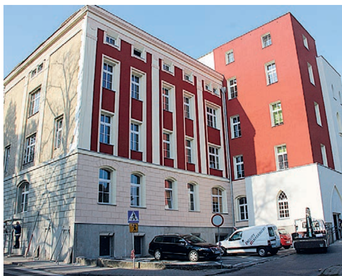
fol. budynek Bystrzyckiego Centrum Zdrowia