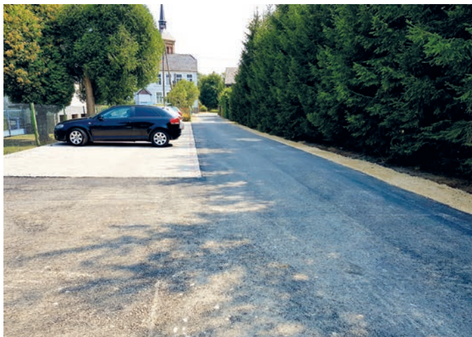
fol. droga Gminna w kierunku parkingu przyszkolnego

4. Usługi w zakresie konserwacji i utrzymania oświetlenia drogowego i parkowego na terenie wsi Długopole Dolne w latach 2014 – 2018 roku.